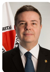
ANTÔNIO AUGUSTO ANASTASIA

Doutor em Ciência Política pela Universidade Federal de Minas Gerais. Coordenador do Eixo de Sistemas, Governança e Identificação do Programa das Nações Unidas para o Desenvolvimento (PNUD).